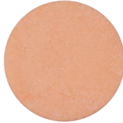
ShampooBar Red Alle Haartypen