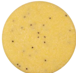
ShampooBar Yellow Vet Haar