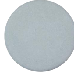
ShampooBar Blue Krullend Haar