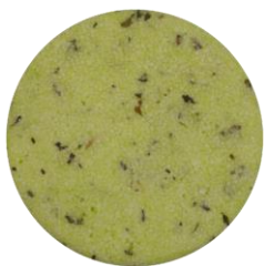
ShampooBar Green Droog Haar

Hieronder zie je onze shampoo bars, speciaal voor elke haartype een speciale bar